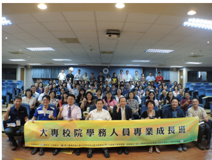
全國首次大專校院學務人員專業成長班研習 朝陽科大展開

(中央社訊息服務 20150827 17:45:19)國內首次針對大專校院學務人員的專業能力提升研習活動 8 月 27 日於朝陽科技大學熱鬧展開，本次研習共計有來自全國 82 所大專校院之學務人員參與，教育部學務及特殊教育司司長劉仲成亦親臨主持始業式，並以「建構友善校園：教育部的政策與作法」為題發表演說，顯見教育部對於此一研習的高度重視。